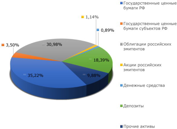
Структура пенсионных резервов АО НПФ ПСБ на 31.10.2024 по видам активов